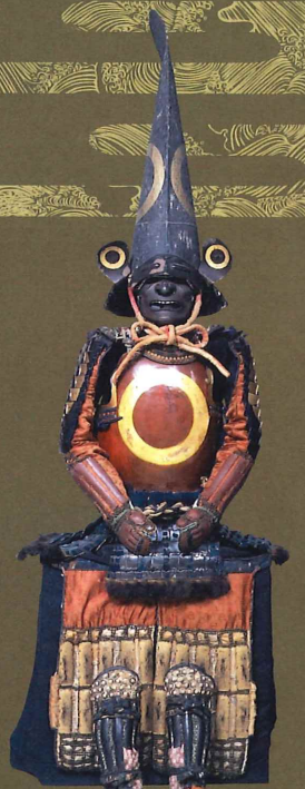
白檀塗蛇の目紋袴絵具脚具足 附 蛇の目紋長鳥帽子形兜 (本妙寺蔵)

出品協力: 仙台市博物館、米沢市上杉博物館、真田宝物館、公益財団法人前田育徳会、大阪城天守閣、毛利博物館、福岡市博物館、立花家史料館、本妙寺、公益財団法人鍋島報効会