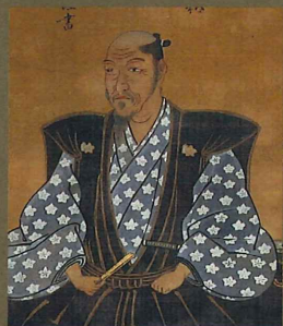
加藤清正画像 (佐賀県立名護屋城博物館蔵)