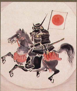
伊達政宗甲冑像 (複製 / 仙台市博物館蔵)