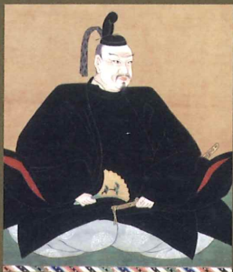
毛利輝元像 (毛利博物館蔵)