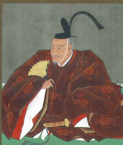
鍋島直茂像 (公益財団法人鍋島報効会蔵)