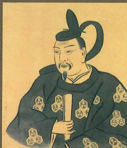
直江兼統像 (米沢市上杉博物館蔵)