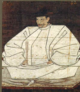
豊臣秀吉画像 (佐賀県重要文化財 / 佐賀県立名護屋城博物館蔵)