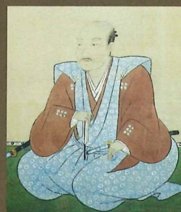
伝 真田信繁画像 (真田宝物館蔵)