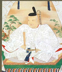
東照宮御影 (複製 / 佐賀県立名護屋城博物館蔵 / 公益財団法人徳川記念財団原蔵)