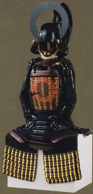
鉄鍬包月輪文最上脚具足 (立花家史料館蔵)

本企画展では、名護屋に参陣した著名な大名・武将を象徴する資料を一堂に展示するとともに、発掘調査等によって明らかとなった諸大名陣屋の様子を紹介し、日本史上類を見ない政治・経済・文化のつぼと化した「肥前名護屋」の姿を描きます。