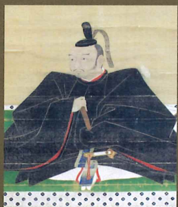
立花宗茂肖像画