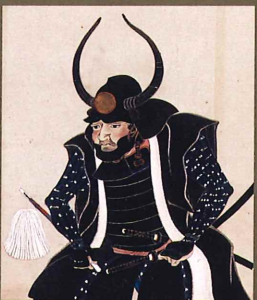
黒田長政像 (福岡市博物館蔵)