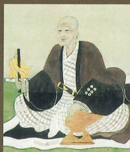
伝 真田昌幸画像 (真田宝物館蔵)

主催: 名護屋城博物館 後援: 唐津市、唐津市教育委員会、一般社団法人唐津観光協会、肥前名護屋城歴史ツーリズム協議会