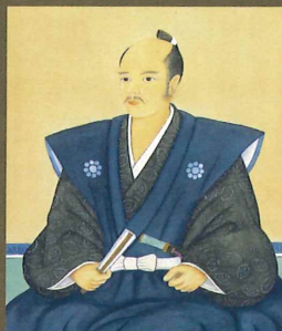
石田三成画像 (大阪城天守閣蔵)