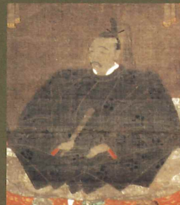
高德公尊像 (公益財団法人前田育徳会蔵)