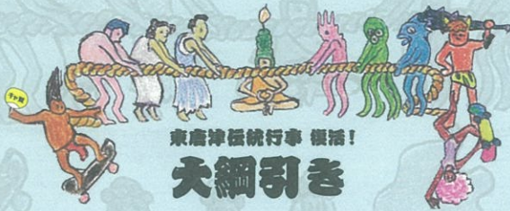
東唐津伝統行事 復活！ 大綱引き

玉入れ・ラムネ早飲み・ピーサン飛ばし・盆踊りなど。 目玉は東唐津の伝統行事である大綱引き！