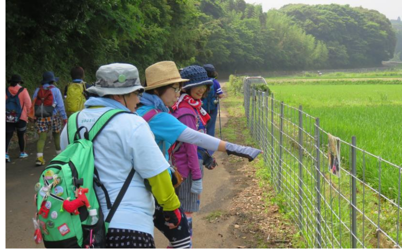
九州オルレ唐津コース