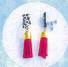
HIZEN5 やきものアクセサリ 「唐津モデル」

アンケートに答えて抽選 (5名様) で 「HIZEN5」やきものアクセサリをGETしよう!