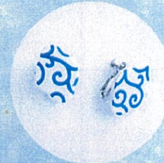
HIZEN5 やきものアクセサリ 「有田モデル」

※画像の商品はサンプルです。1点モノのため、違ったイメージのアイテムが当選する場合がありますので、予めご了承ください。※商品の発送をもって当選の発表に代えさせていただきます。