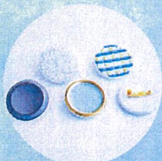
HIZEN5 やきものアクセサリ 「伊万里モデル」