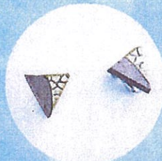
HIZEN5 やきものアクセサリ 「武雄モデル」