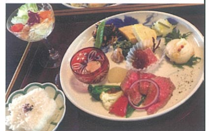
佐賀牛のローストビーフ付き特別ランチのイメージ

場所：町屋カフェ「野いちご」 〒847-0042 佐賀県唐津市魚屋町2041(裏面地図参照)