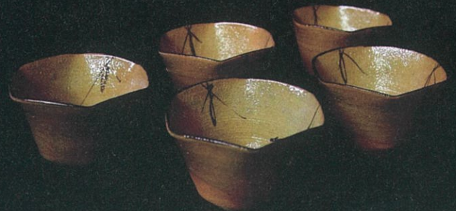
絵唐津三方向付五客