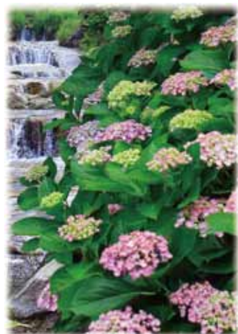
写真:第30回フォトコンテスト入賞作品 川原義則(伊万里市)