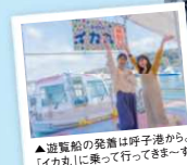
▲遊覧船の発着は呼び港から「イカ丸」に乗って行ってきませーず