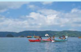
▲ガイドのナビゲートで無人島を1周。自然との一体感を味わえる