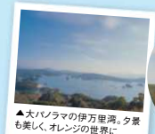
▲大パノラマの伊万里湾。夕景も美しく、オレンジの世界に

唐津市肥前市民センター ☎0955-53-7145 匠佐賀県唐津市肥前町満越314 観覧料自由 画西九州道北波多ICより25分 ①10台