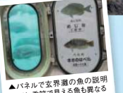
▲パネルで玄界灘の魚の説明があり、季節で見える魚も異なる