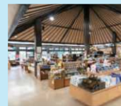
▲お土産を扱う物産館、加工品やお菓子、工芸品と幅広い品揃え

☎0955-51-1051 匠佐賀県唐津市鎮西町名護屋1859 直売所9時~18時、海舟11時~18時 物産館により異なる 伊ノ浦イカ一夜干1,500円、あまなつカレー540円、イカ活き造り定食2970円 画西九州道産津ICより30分 ②94台