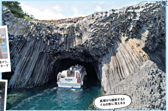
▲国の天然記念物にも指定されている七ツ釜へいざ潜入!