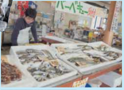
▲魚はBBQ用にカットや刺身(1尾200円~)にも使われる

☎0955-82-3331 匠佐賀県唐津市呼子町呼子1740-11 9時~18時 休不定 匠バーベキュー 炭台小学生以上1名200円~ 画西九州道産津ICより30分 ②50台