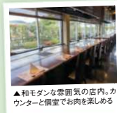
▲和モダンな個室の店内。カウンターと個室で肉を楽しめる

☎0955-56-8866 唐佐賀県唐津市浜玉町横田下954 唐11時～15時(LO14時)、17時～22時(LO21時) 唐休木 唐本日のお肉 鉄板焼ステーキランチ(150g)2695円 唐西九州道二丈農家ICより5分 唐24台