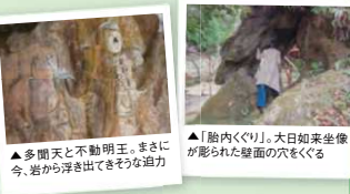
▲多聞天と不動明王。まさに今、岩から浮き出でそうな迫力