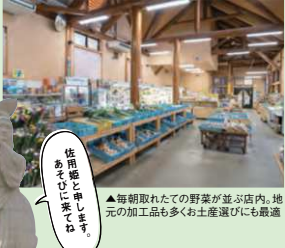
▲毎朝取れたての野菜が並び店内。地元の加工品も多くお土産選びにも最適

☎0955-63-3737 唐佐賀県唐津市蔵木町牧場692-1 唐直売所8時～18時 唐休1/1,2 唐佐用姫だんご290円、豚足330円、蔵木温泉の美味しい蒸したまご50円 唐蔵木多久有料道路牧瀬ICより1分 唐62台