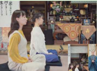
▲和尚さんが姿勢や呼吸法をレクチャーしてくれるので、坐禅初心者でも安心

☎0955-78-2302 唐佐賀県唐津市千々賀2452 唐開催日: 第2・4日曜7時～9時 唐無料 唐西九州道唐津千々賀山ICより3分 唐30台