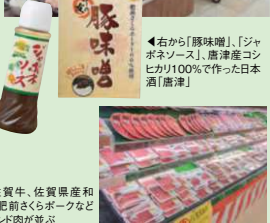
▶佐賀牛、佐賀県産と牛、肥前さくら豚などブランド肉が並び

☎0955-78-1313 唐佐賀県唐津市久里1961-2 唐直売所9時～18時、食事処11時～16時 唐不定 唐ジャポネソース680円、唐津(720円)1900円、唐味噌680円 唐西九州道唐津ICより2分 唐320台