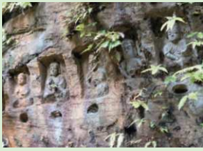
▲東面壁には、十一面観音坐像や千体仏像などが鎮座している

佐賀県指定史跡の石仏群。かつて空海が唐より帰朝した際、阿弥陀・釈迦・観音の三尊を刻んだという洞窟跡。その三尊は現存しないものの、岩壁には、南北朝時代に作られたと見られる石像、江戸時代までに作られた大小60数体の磨崖仏が残っている。