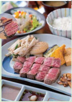
▲1日10食限定の「鉄板焼ステーキランチ」。肉の部位はその日のお楽しみ ※1) 直営牧場の有(中)村牧場独自の飼育方法で育てた黒毛和牛を「なかむら牛」として提供