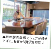
▲目の前の鉄板でシェフが焼き上げる。お昼から買込時間短縮