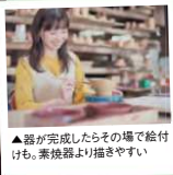
▲器が完成したらそこで贈り物も。素焼きより描きやすい