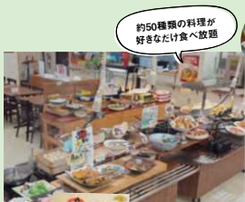
約50種類の料理が好きなだけ食べ放題