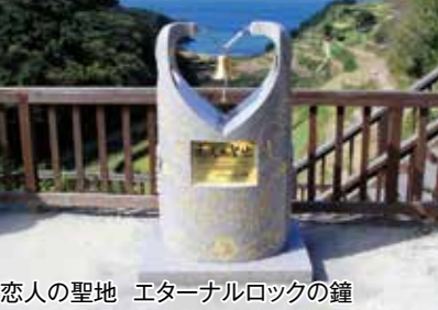
恋人の聖地 エターナルロックの鐘

「エターナルロック」 『エターナルロック』とは永遠の鍵のLockと石のRockをあわせた意味です。二人の手をエターナルロックに通して鐘を鳴らすことで二人の絆がLockされるように愛し合う二人が、しっかりと手を結び、鐘を3回鳴らせば幸せになれるといわれています。