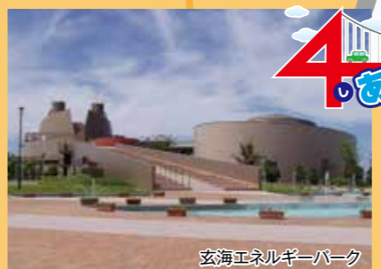
玄海エネルギーパーク