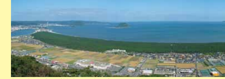
虹の松原全景(鏡山から望む)

日本三大松原※に数えられる虹の松原は、約400年前に、初代唐津藩主 寺沢志摩守広高が防風・防潮のため、海岸線の砂丘にクロマツを植林したのが始まりとされています。今日では、クロマツを中心に約100万本の松が生い茂る日本一の松原を形成しています。 ※虹の松原(佐賀県)、三保松原(静岡県)、気比の松原(福井県)