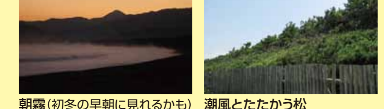
朝霧(初冬の早朝に見れるかも) 潮風とたたかう松 松のトンネル 秋の松原 雪の松原