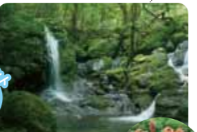
オオキツネノカミソリ