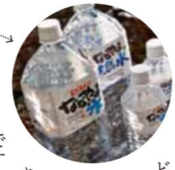
主に唐津地区で販売されている「ななやまの天然水」

「今も私が住む地域では各家庭に井戸があり、井戸水を利用しています。『ななやまの天然水』も日本の滝100選に選ばれた『観音の滝』の地下三〇〇メートルから採取しています。」