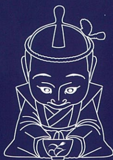
五福の縁結び童子

今は知らないあなたとあなた ほくが繋いであげようか ご縁のいとこの両端を 結べばできる幸せの輪