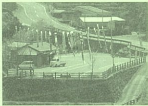
蕨野棚田交流広場