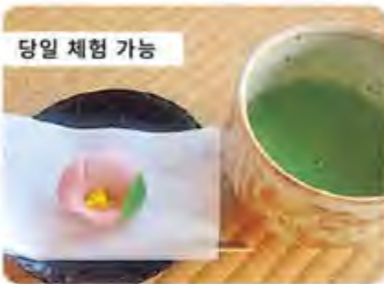
당일 체험 가능

문의: 다원 '가이게쓰' http://www.chaen-kaigetsu.jp/ Email: kaigetsu@mirror.ocn.ne.jp