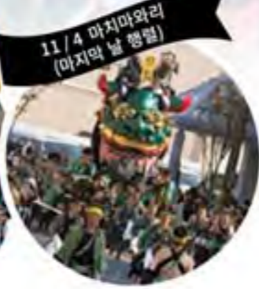
11/4 마치와리 (마지막 날 행렬)