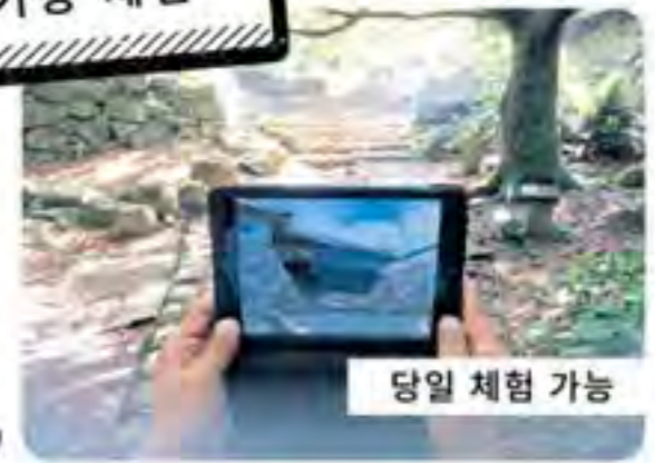
당일 체험 가능

문의: 사가현 나고야 성 박물관 http://saga-museum.jp/nagoya/ Email: nagoyajouhakubutsukan@pref.saga.lg.jp