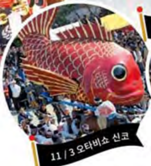
11/3 오타비쇼 신코