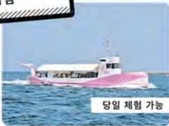
당일 체험 가능

●지라 (중학생 이상) 2,100원 (초등학교생) 1,050원 ●이카마루 (중학생 이상) 1,600원 (초등학교생) 800원