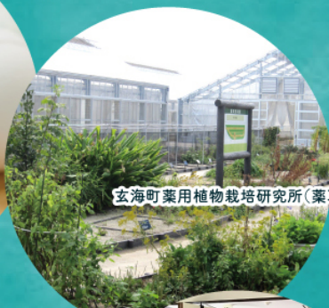
玄海町薬用植物栽培研究所(薬草園)