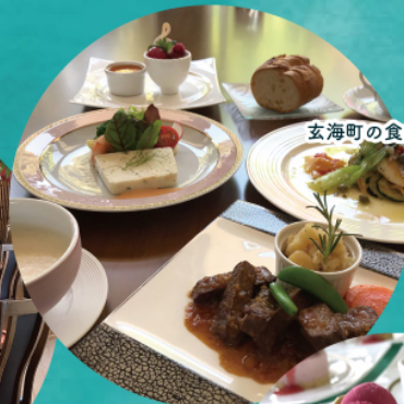
玄海町の食材を生かした料理