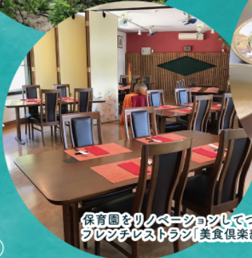
保育園をリノベーションしてつくられたフレンチレストラン「美食倶楽部 富高岩」