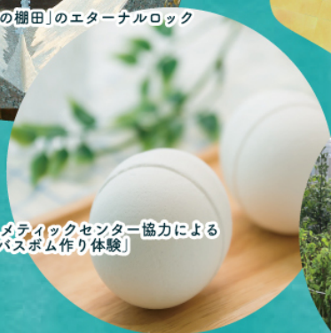
ジャパン・コスメティックセンター協力による「バスボム作り体験」