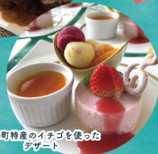
玄海町特産のイチゴを使ったデザート