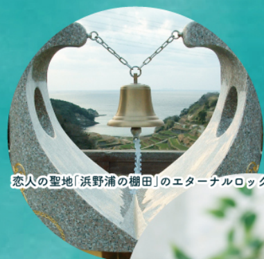
恋人の聖地「浜野浦の棚田」のエターナルロック