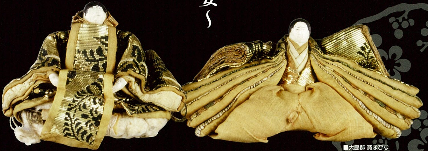
■大島部 寛永ひな (期間中、旧唐津銀行にて展示)