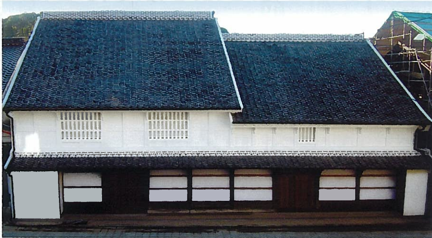
復原された主屋外観

鯨組主中尾家屋敷は、江戸時代に鯨組主として巨万の富を築いた中尾家の屋敷として建てられた建物です。特に、主屋は当時の姿をよく残しており、唐津市の重要文化財に指定されているほか、佐賀県が認定した22世紀に残す佐賀県遺産、唐津市の景観重要建造物にも指定されています。