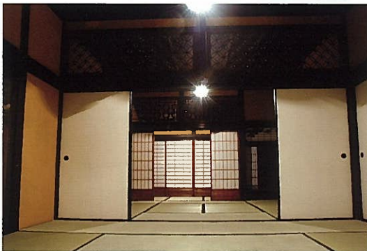
客人をもてなした座敷