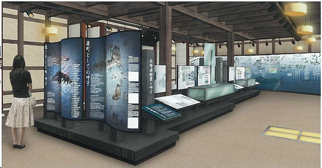
勘定場跡(本倉)の展示コーナーイメージ