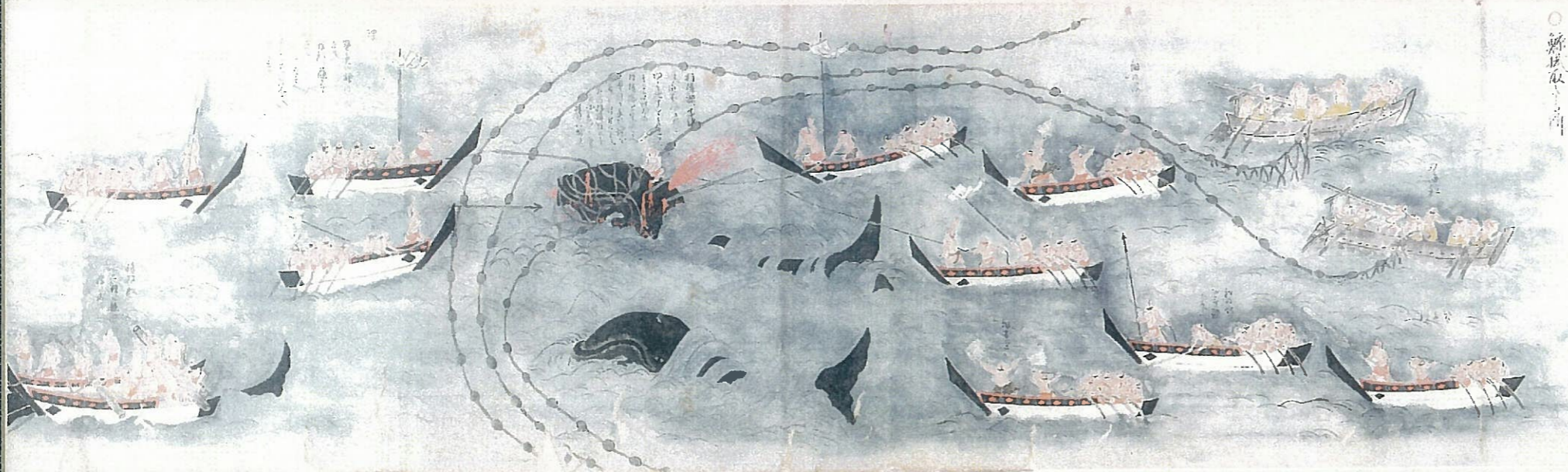
「小児の弄鯨一件の巻」(上村家本)

古来より、鯨と生きてきた町、呼子 海の恵みは、人々に活気をよえ、 豊かな文化が育まれてきた