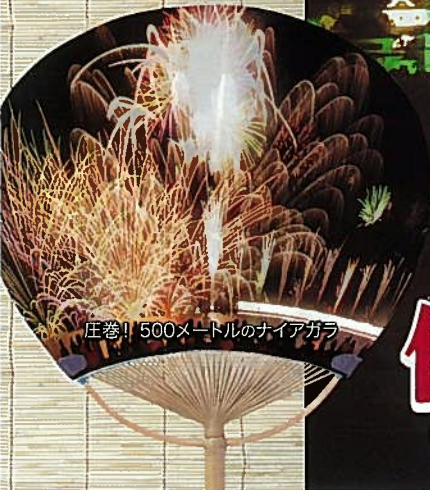
圧巻!! 500メートルのナイアガラ