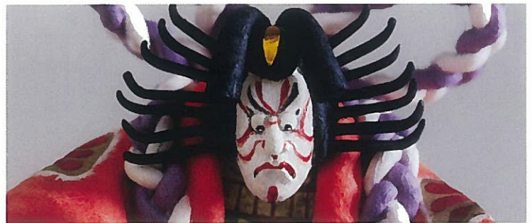
小林ミネ子作：紙塑人形