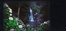
滝を22:00までライトアップ