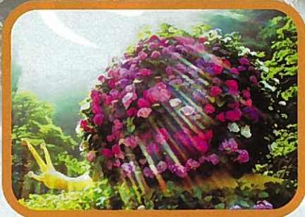
あじさいトピアリー