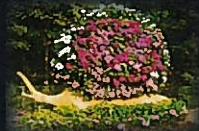
あじさいのトピアリー