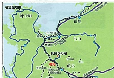
●福岡市から車で約80分(約70km)

JR JR九州 おこしの際はJRをご利用ください。(唐津線 相知駅下車) 土日はシャトルタクシーを運行しています。