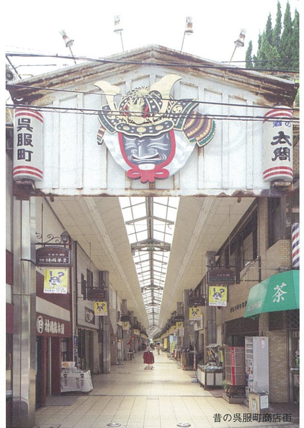
昔の呉服町商店街

唐津の中心部にある呉服町商店街は、アーケードを撤去し、個性あるお店と、地元の方々や観光客が集って自然と会話・ご縁が生まれることを願って、「五福の縁結び通り」として装い新たに生まれ変わります。"新生"呉服町商店街に是非足をお運びください。