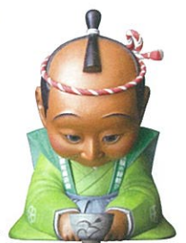
五福の縁結び童子