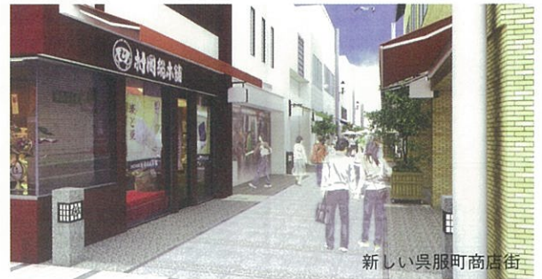
新しい呉服町商店街