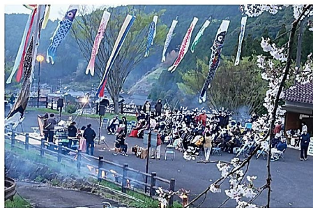
昨年度のコンサートの様子

菜の花の咲く棚田と桜の並木をバックに、4組の演奏をお楽しみください ※雨天時は、蕨野公民館で開催します