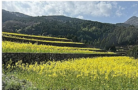
昨年度の菜の花の様子

10月末に開催した『菜の花種まき交流会』で菜の花の種をまいた棚田を巡る約3kmのコースです