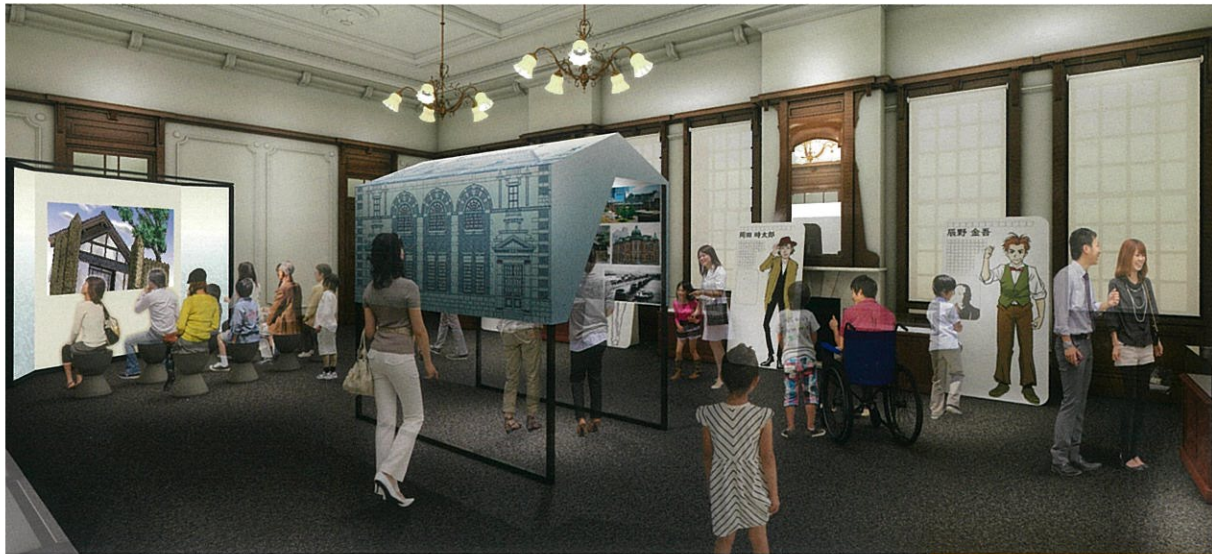
唐津サテライト館イメージ

明治維新から150年。 唐津サテライト館では、幕末維新期を中心に活躍した唐津の偉人やその偉業を紹介しします。