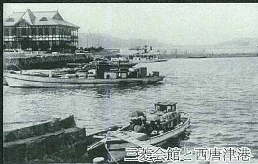
三菱会館と西唐津港