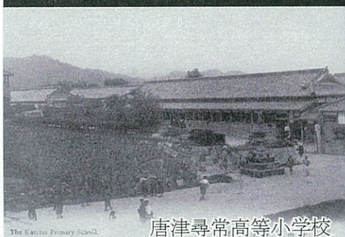
唐津尋常高等小学校