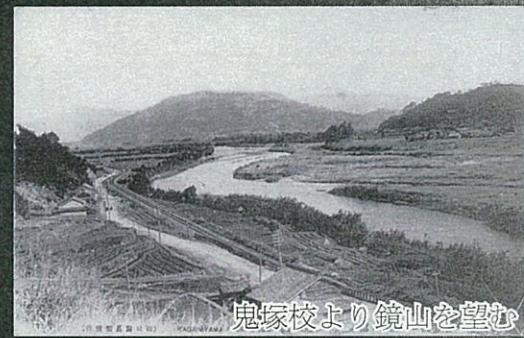
鬼塚校より鏡山を望む